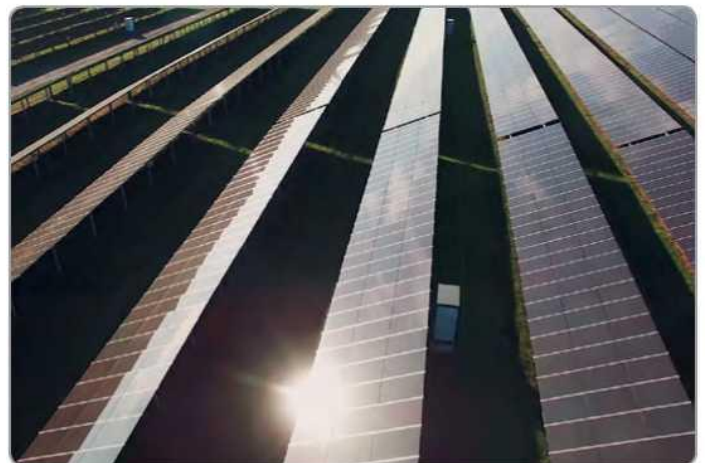
Copernicus hilft bei der Suche nach geeigneten Flächen für eine effiziente und ökologische Produktion erneuerbarer Energien.

Das Besondere an dieser raumbasierten Lösung ist, dass die ökologischen und wirtschaftlichen Aspekte der Produktion erneuerbarer Energien berücksichtigt werden. So werden beispielsweise Faktoren wie die Entfernung zu Biogasanlagen (hinsichtlich Transportkosten und Treibhausgasemissionen) und bestäubungsfreundliche Erntezyklen bei der Beurteilung des Potenzials für den Anbau von Bioenergiepflanzen berücksichtigt.